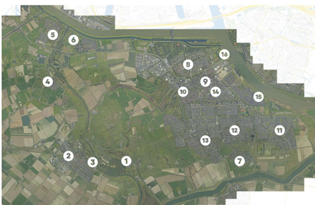
Figuur 1; Locaties van de praat-mee momenten

Tijdens de praat-mee momenten spraken we soms mensen die in een andere dorp of wijk woonden dan waar we op dat moment stonden. Deze inbreng is meegenomen in de opbrengst van de betreffende wijken.