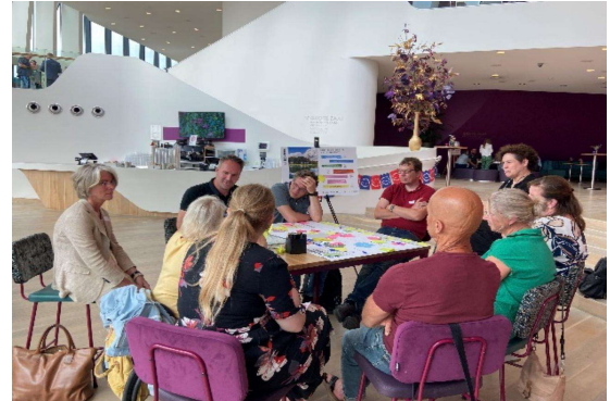
Afbeelding 1: Stakeholdersbijeenkomst 27 juni

Deze grote bereidheid, in combinatie met de inzet van de brede communicatiecampagne en verschillende participatiemiddelen, heeft ervoor gezorgd dat we de “stille meerderheid” 1 hebben kunnen bereiken en spreken. Vanuit alle wijken en dorpen hebben inwoners meegedacht.