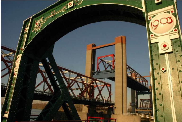
Afbeelding 2: Spijkenisserbrug

Over het winkelaanbod zijn de meningen verdeeld, maar vooral in de dorpen (met uitzondering van Heenvliet) en in de wijken Schiekamp en de Vierambachten is dit een belangrijk punt.